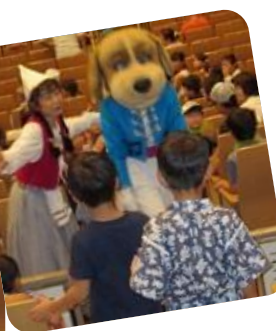
終演後、動物たち が客席に降りてきて みんなと握手(^o^)