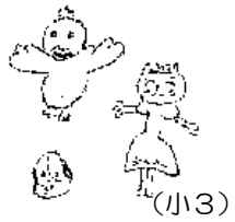
開演前のあいさつを頑張る劇場っ子たち。