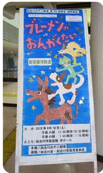
おやこ劇場恒例の手作り立て看板♪