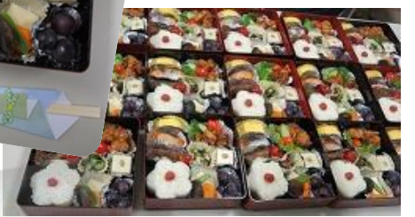
劇団への感謝の気持ちを、プレゼントや昼食に いっぱい詰め込んで、会員みんなで準備。