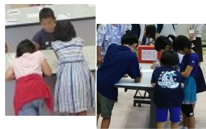
感想文コーナーも大にぎわい♪