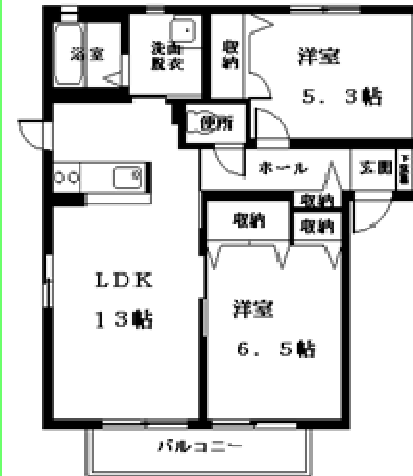
A 2LDKタイプ 間取反転タイプ有