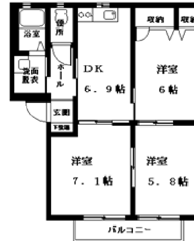
B. C. D 3DKタイプ 間取反転タイプ有