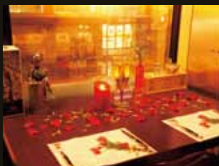
厳選されたワインと料理、そしてクリスマスの程よい喧騒を感じながら、スペシャルな時間を

前菜2種、オマール海老の Pasta、真鱈のブランド風、和牛ほほ肉の赤ワイン煮込み、フォンダンショコラ、コーヒーが並ぶ特別ディナー。手頃なグラスワインは700円～